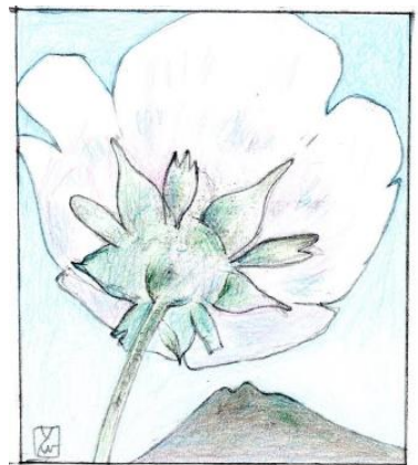
チングルマと岩木山

CT：自宅 6:25 - 鴨居 6:53 - JR 高尾北口 7:50/8:12 - 日影沢 キャンプ場 9:00 - 城山 11:25/12:00 - 高尾山口 15:15 - 八 王子 15:50 - 鴨居 16:25 - 自宅 16:55