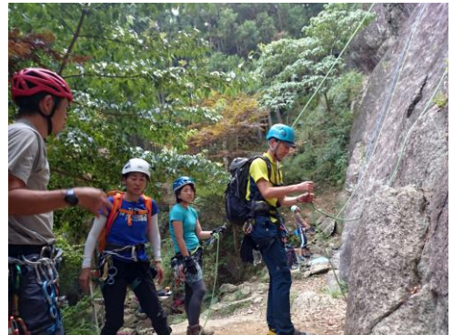
ザックを背負って左ルートに行く