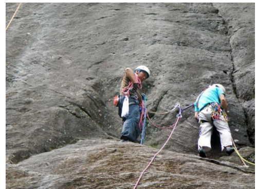
左ルート下部で登攀と懸垂を繰り返す