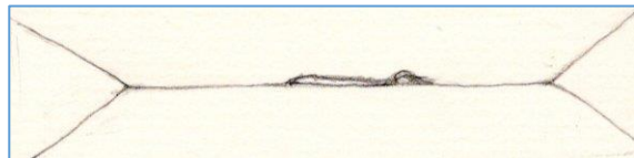
「オナガグモ」 2019-09-26 細い線はクモの巣。簡単な蜘蛛の巣を張る。中央がオナ ガグモ(ほぼ実物大)左に細長い胴、右が脚。他のクモが 近づくと粘液でぐるぐる巻きにし、体液を吸う。別名クモ クイグモ。

ジョロウグモ 縞模様のジョロウグモは巣の真ん中に大きくドンと構えています。メスで す。ところがよく見ると巣の端に小さなクモがいます。メスの十分の一くらい。オスです。交 尾の瞬間を待っています。メスが居眠りをしたり、餌に夢中になっている時がチャンスです。 失敗したらウンノツキ。食べられてしまいます。クワバラクワバラ。