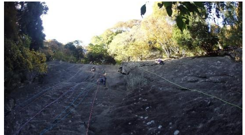
岩場は混雑し、常に何本ものロープがかかっていた