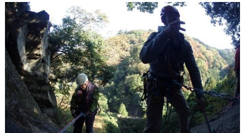
終了点からは向かいの山肌の紅葉がよく見えた