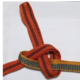
シートバンド 結び方